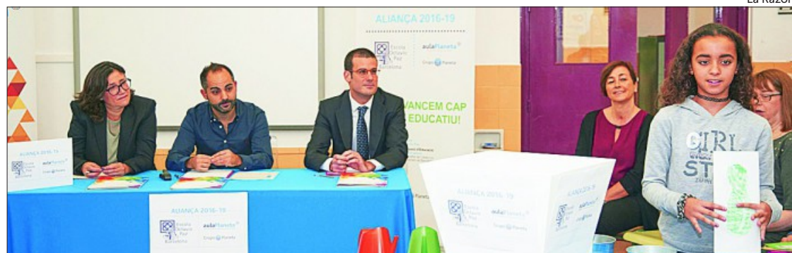
Planeta dotará a la escuela Octavio Paz de los equipamientos necesarios para la transformación pedagógica

En este sentido, hace apenas un año, con la entrada de la nueva dirección, la Escuela Octavio Paz emprendió un cambio en su proyecto pedagógico, una evolución orientada a «mejorar el proceso de aprendizaje para conseguir la excelencia personal y educativa de los alumnos», señala Xavier